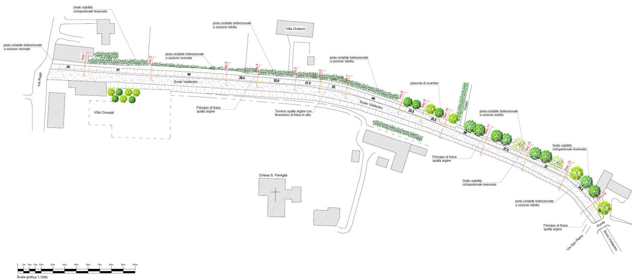
Figura 1 - Schema planimetrico area di intervento

Si evidenzia che il lavoro nel suo complesso è da intendersi a corpo.